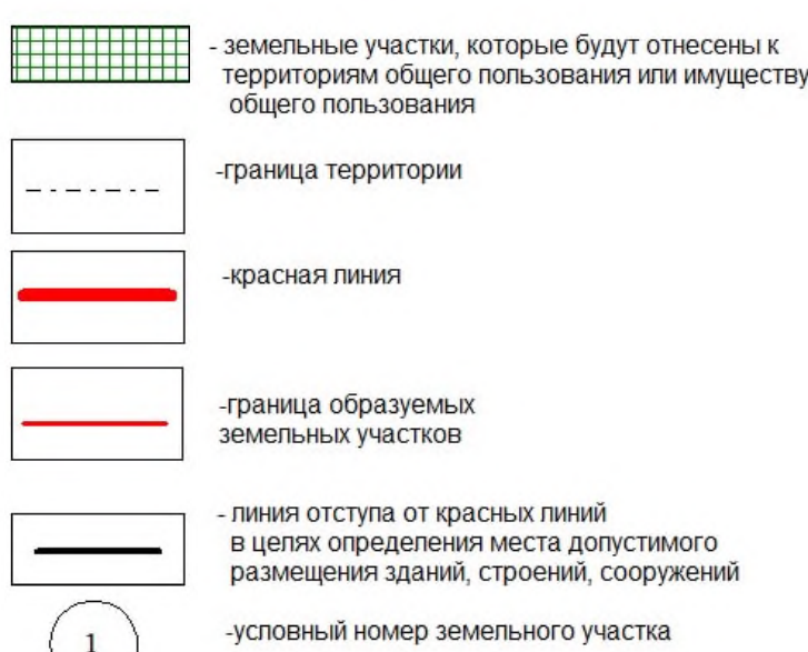
Сведения об образуемых и существующих земельных участках