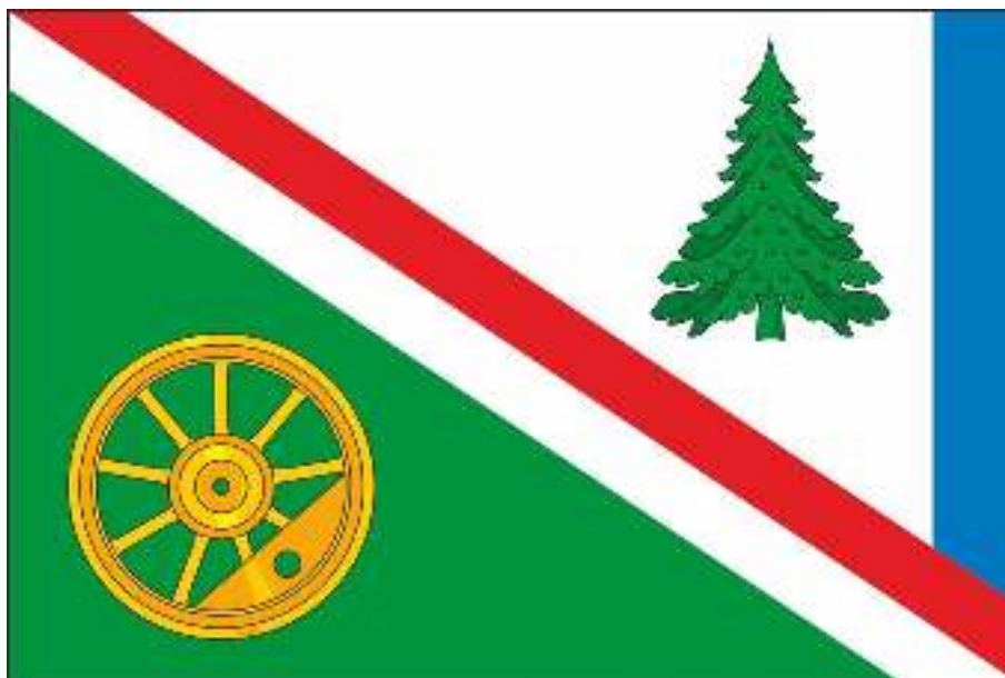
Флаг Вихоревского муниципального образования (цветное изображение)